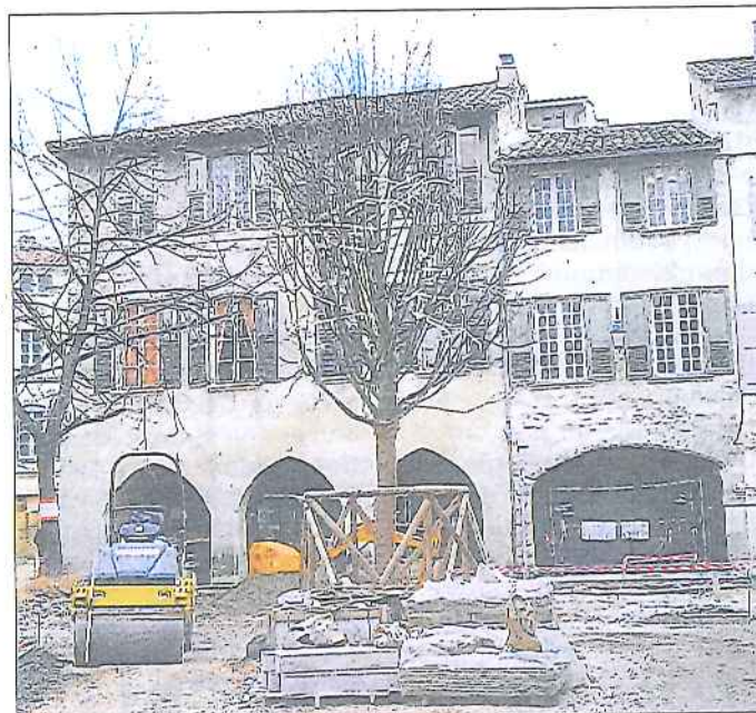
Le tilleul a remplacé le platane sur la place Meissonnier.