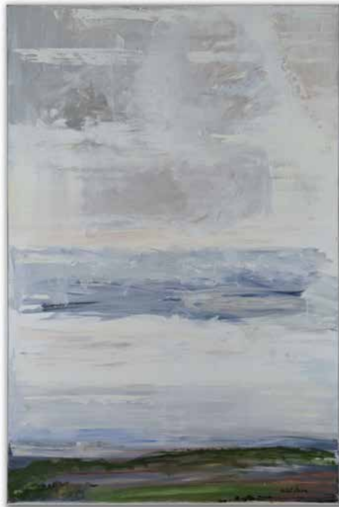
Grand ciel II , huile sur toile, 195 x 130 cm, non daté. chargement image