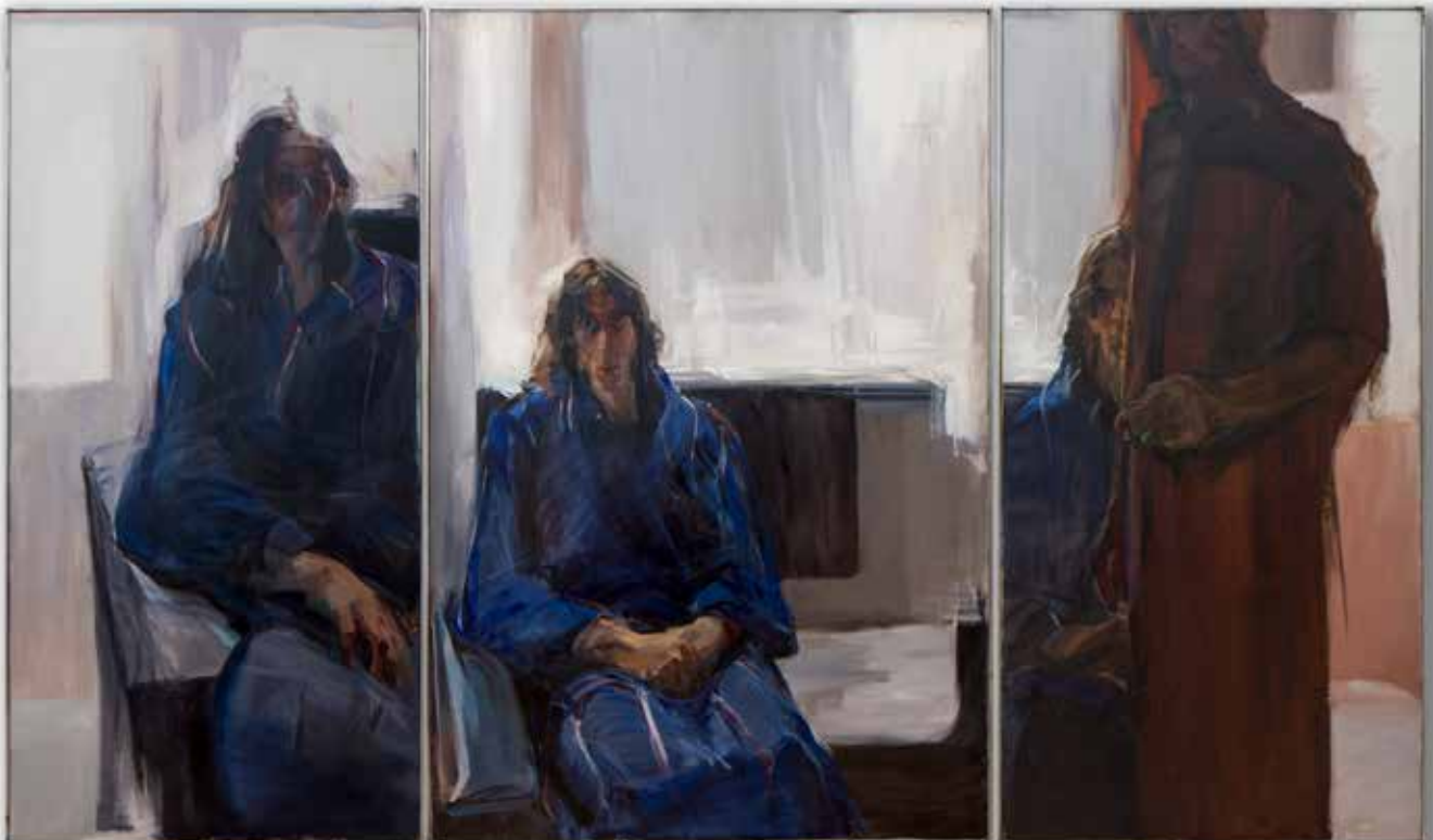
Triptyque, Thierry, la robe de chambre bleue, huile sur toile, 195x (97, 130, 97), non daté. chargement image