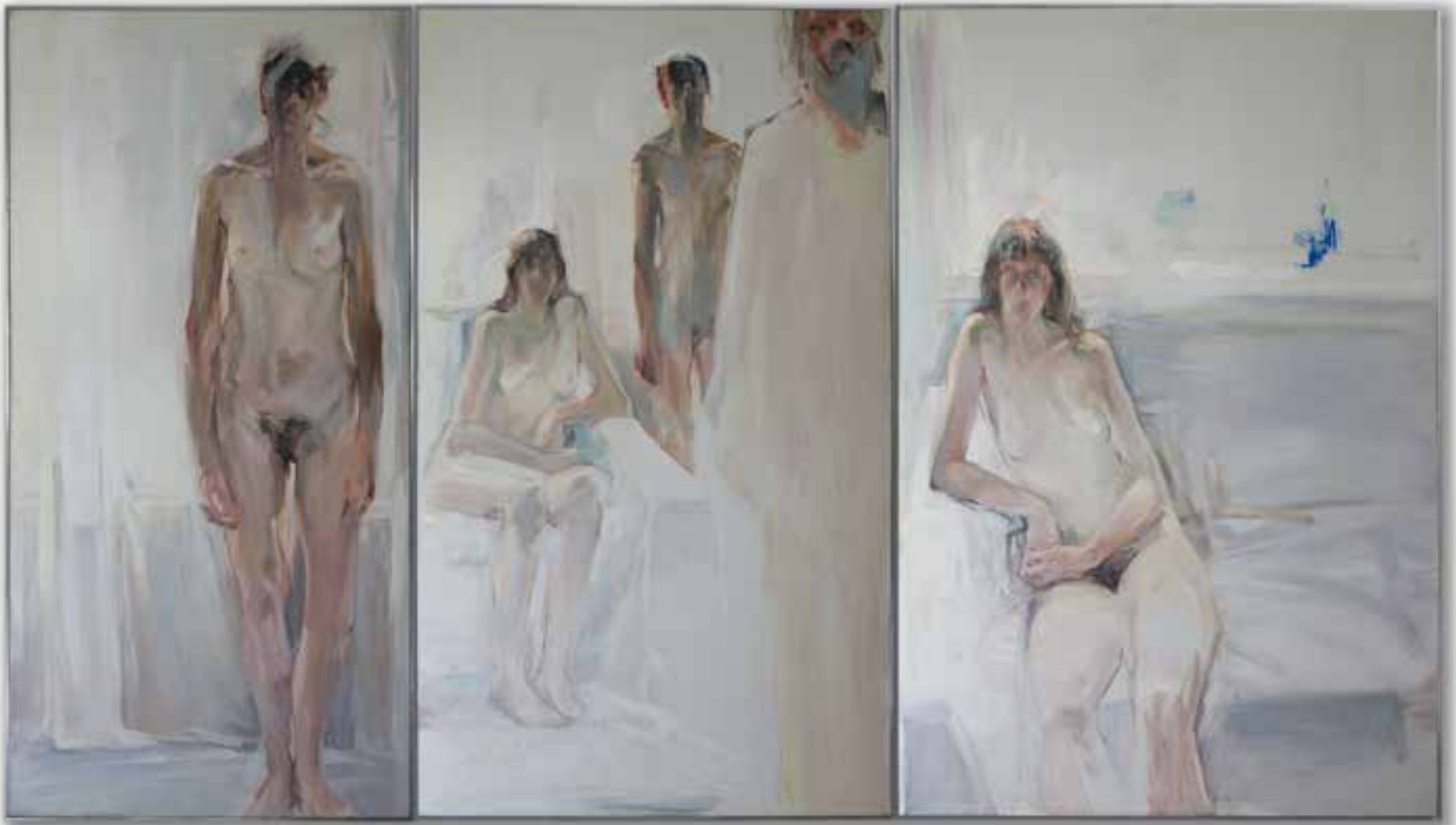
Triptyque, Présences dans l'atelier , huile sur toile, 195x (97, 130, 114), non daté. chargement image